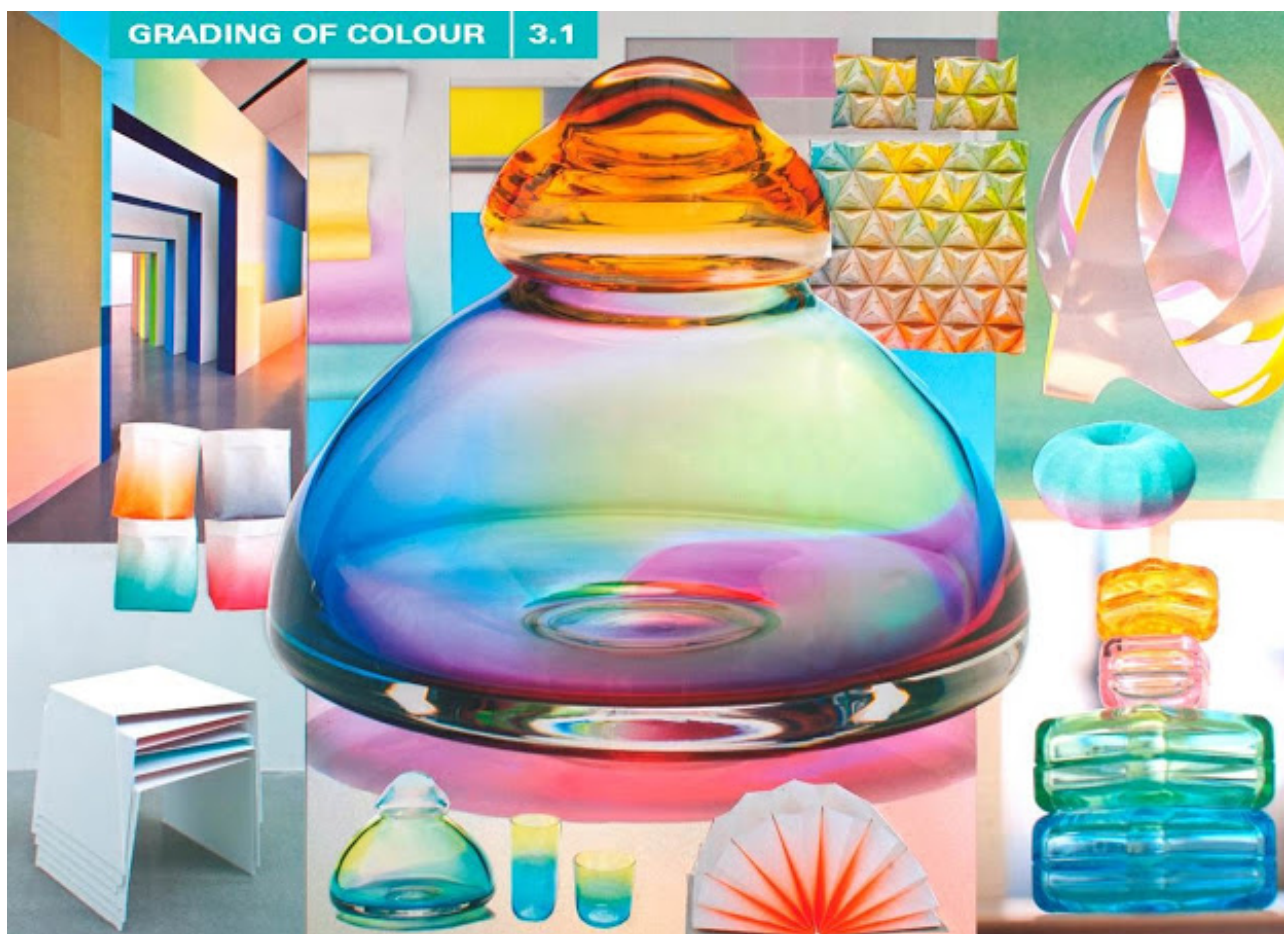
Grading of Colour | Trendcollage interieur 2014/2015

Deze foto's hebben copyright, maar ze mogen met naamsvermelding "Milou Ket" en een linkje naar dit interview gedeeld worden.